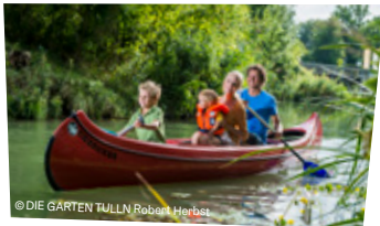
Ab in die Boote