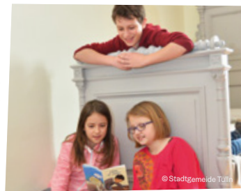
Den jungen Schiele entdecken

Die vorbeifließende Donau auf der einen Seite, spannende Erlebnisse auf der anderen Seite – radle entlang der Donaulände und entdecke die ökologische Gartenstadt Tulln mit all ihren Angeboten speziell für Kids! Auf deinem Weg wirst du zum Gartenentdecker auf der GARTEN TULLN – mit Baumwipfelweg und dem größten Naturspielplatz Niederösterreichs. Begib dich auf die Spuren von Römern und Nibelungen , die auf denselben Wegen wie du gewandert sind. Tauch ein in die Welt des kleinen Egon Schiele , der am Hauptbahnhof in Tulln geboren wurde und entdecke die naturnahen Spiel- und Erlebnisräume – zum Beispiel die Donau.Spuren.Langenlebar und das Tullner Aubad .