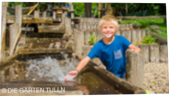
Abenteuer im Garten